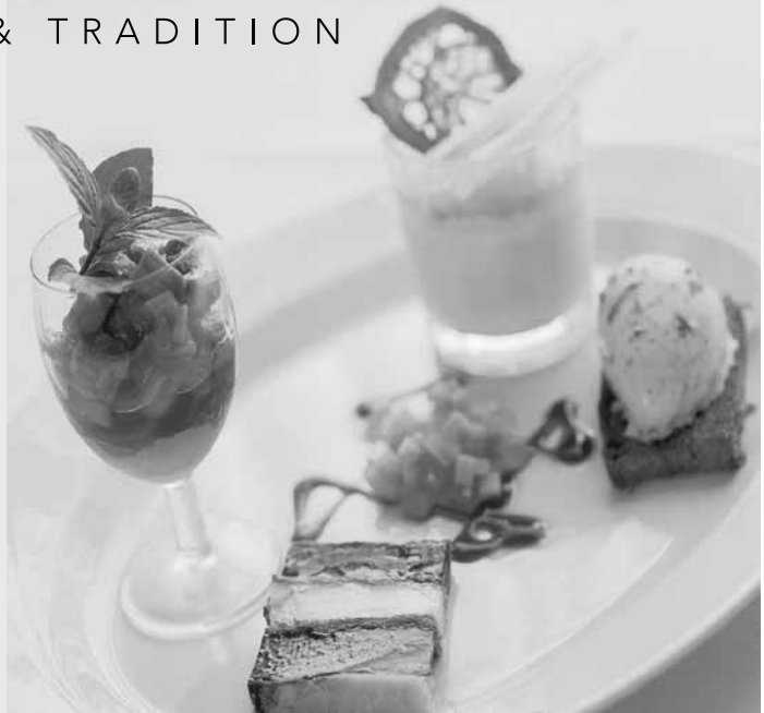
Foto: Dessert La Cocotte