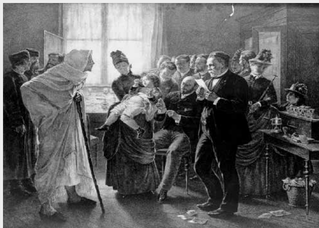
Vaccination in Pasteur's clinique in Paris

Call-centret er åbent hverdage i perioden 18/9 – 29/9 i tidsrummet 8.30 – 15.00.